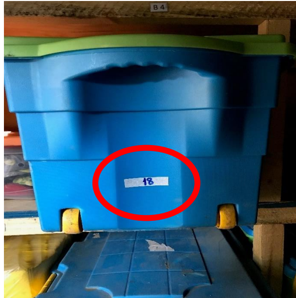
IMAGEN No.3. En la siguiente imagen se puede identificar la forma de almacenamiento en la bodega B, donde se encuentran la mayoría de los artículos. Además, se puede apreciar que cada caja se encuentra en una posición.

IMAGEN No.2 En la siguiente imagen se puede identificar un código numérico, correspondiente a al número de caja.